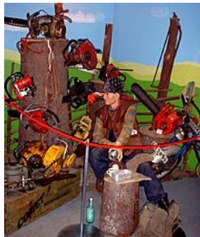
några små exempel på miljöer